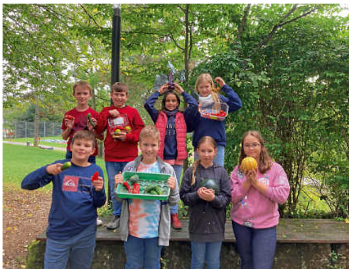
Schülerinnen und Schüler der Schulgarten-AG mit frisch geerntetem Gemüse

Die Schülerinnen und Schüler haben ihren Garten überzeugend in einem kleinen Video vorgestellt und die wöchentliche Arbeit in Fotos dokumentiert. Die Arbeit im Schulgarten bietet nicht nur die Möglichkeit, die Natur zu erleben und leckeres Obst und Gemüse zu ernten, sondern fördert auch wichtige Werte wie Gemeinschaftssinn und Teamarbeit. Die AG trifft sich wöchentlich im Schulgarten, im Werkraum oder in der Schulküche, um gemeinsam zu arbeiten und zu kochen. In den Wintermonaten wurde beispielsweise die reiche Kartoffel- und Kürbisernte verarbeitet und viele Nistkästen und Futterglocken für die heimischen Vögel gebaut. Die nächsten Projekte werden der Neubau der Kompostanlage sowie die Pflanzenanzucht für den beliebten Gemüse-Pflanzenverkauf Anfang April sein.