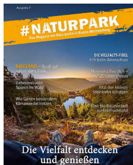
Das jährlich erscheinende Magazin #Naturpark beleuchtet nachhaltige Regionalentwicklung und kulturelles Erbe.

Rückkehr des Storchs im Naturpark Stromberg-Heuchelberg bieten besondere Einblicke. Mit den Blumen- und Genussworkshops im Naturpark Obere Donau oder den Veranstaltungen zum Limes-Jubiläum im Naturpark Schwäbisch-Fränkischer Wald sowie mit dem Bikeländ in Eberbach im Naturpark Neckartal-Odenwald liefert das Magazin Unternehmungstipps für Groß und Klein. In Sachen Genuss hat der Schwarzwald einiges zu bieten, wie man im Beitrag über das Videoprojekt der Naturpark-Wirte der beiden Schwarzwälder Naturparke erfährt. Einen Besuch wert sind auch stets die Naturpark-Zentren der sieben Naturparke – was man dort außer reiner Wissensvermittlung erleben kann, erfährt man ebenso auf vier der insgesamt 69 Seiten des Magazins. (pm/red)