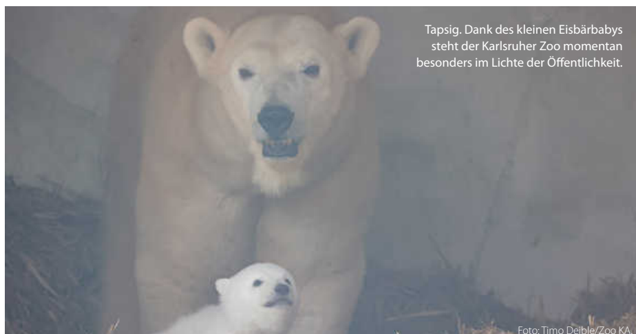
Tapsig. Dank des kleinen Eisbärbabys steht der Karlsruher Zoo momentan besonders im Lichte der Öffentlichkeit.

Apropos Artenschutz. Das Thema ist Reinschmidts wichtigste Antriebsfeder. Seit er die Leitung des Zoos vor sieben Jahren übernommen hat, ist viel passiert: „Wenn der Zoo wie vor 40 Jahren wäre, würde ich mich für die Schließung einsetzen.“ Diese Zeiten der Tierhaltung seien überholt. Sein Ziel: den klassischen Zoo in ein modernes Artenschutzzentrum umbauen. (tam)