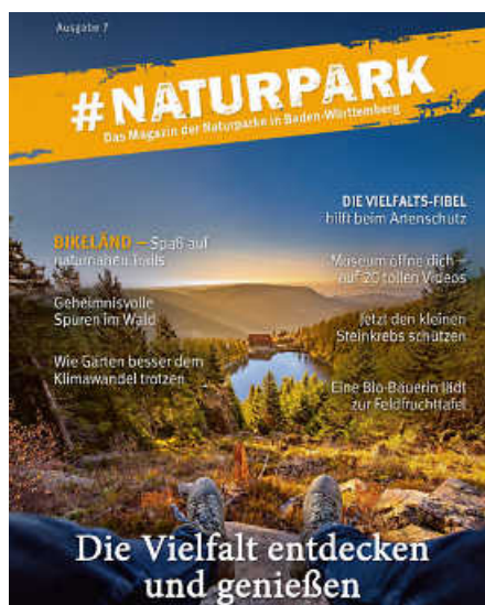
Das jährlich erscheinende Magazin #Naturpark beleuchtet nachhaltige Regionalentwicklung und kulturelles Erbe.

Rückkehr des Storchs im Naturpark Stromberg-Heuchelberg bieten besondere Einblicke. Mit den Blumen- und Genussworkshops im Naturpark Obere Donau oder den Veranstaltungen zum Limes-Jubiläum im Naturpark Schwäbisch-Fränkischer Wald sowie mit dem Bikeländ in Eberbach im Naturpark Neckartal-Odenwald liefert das Magazin Unternehmungstipps für Groß und Klein. In Sachen Genuss hat der Schwarzwald einiges zu bieten, wie man im Beitrag über das Videoprojekt der Naturpark-Wirte der beiden Schwarzwälder Naturparke erfährt. Einen Besuch wert sind auch stets die Naturpark-Zentren der sieben Naturparke – was man dort außer reiner Wissensvermittlung erleben kann, erfährt man ebenso auf vier der insgesamt 69 Seiten des Magazins. (pm/red)