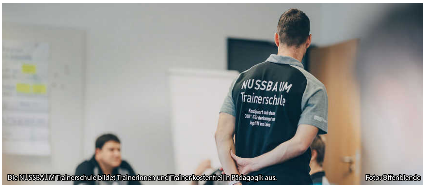
Die NUSSBAUM Trainerschule bildet Trainerinnen und Trainer kostenfrei in Pädagogik aus.