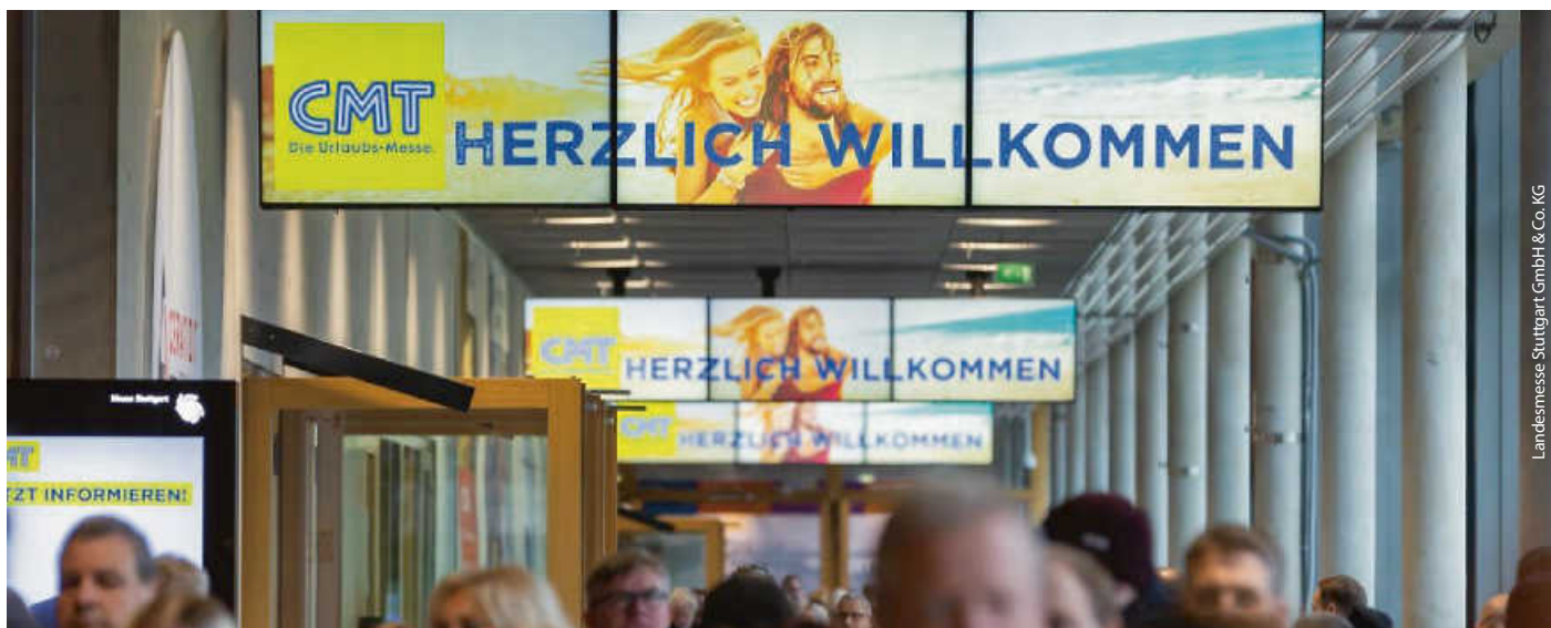
Landesmesse Stuttgart GmbH &amp; Co. KG