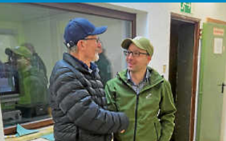
Traditionelles Eröffnungsschießen an Dreikönig

Diese Ausgabe erscheint auch online auf NUSSBAUM.de