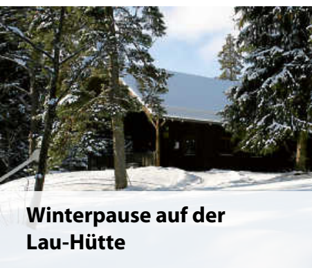
Winterpause auf der Lau-Hütte