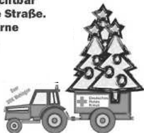
Plakat: DRK Wehingen