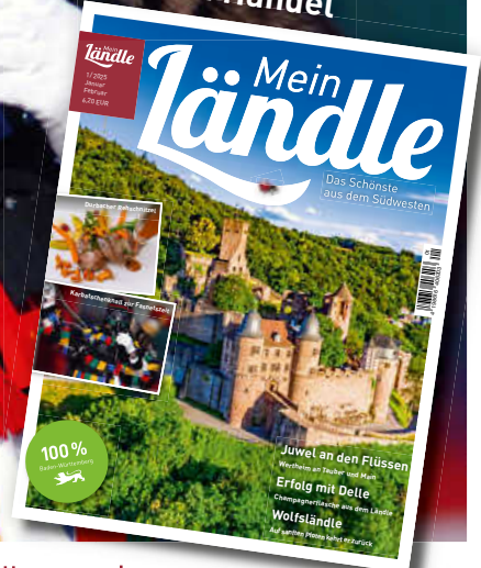
Die Summe der vielen, kleinen Besonderheiten Baden-Württembergs