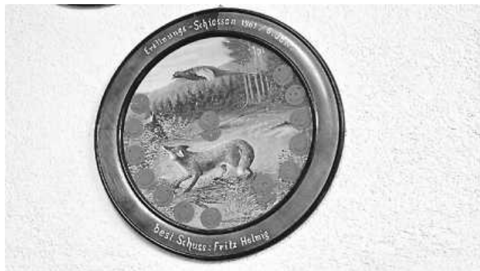
Ehrenscheibe von 1961

Am 6. Januar fand im Schützenhaus Wehingen das traditionelle Eröffnungsschießen zu Dreikönig statt. Umgeben von den alten Ehrenscheiben wurde der Wettkampf ausgetragen, wobei die älteste Ehrenscheibe dieses Eröffnungsschießens aus dem Jahr 1961 datiert.