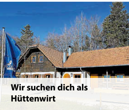
Wir suchen dich als Hüttenwirt