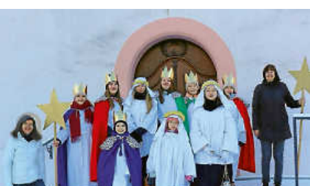
Sternsingeraktion in Egesheim