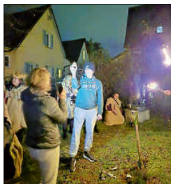
Glückliche Auffindung der Maske