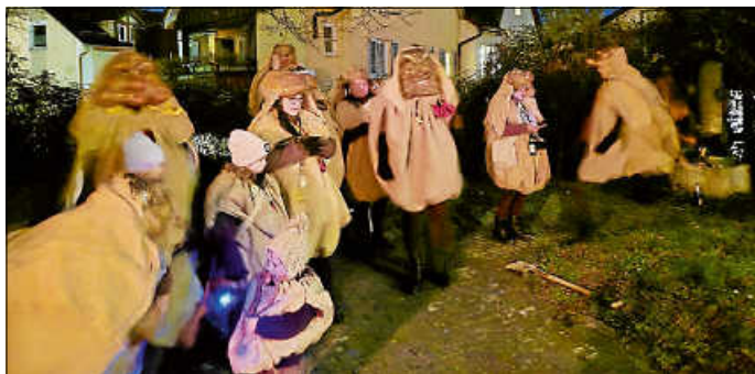
Gespannte Erwartung, ob die Maske gefunden wird