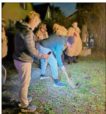
Suche nach der vergrabenen Maske