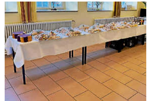
Büfett zum Stehempfang