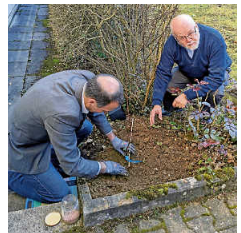
Der Weinstock kann wachsen