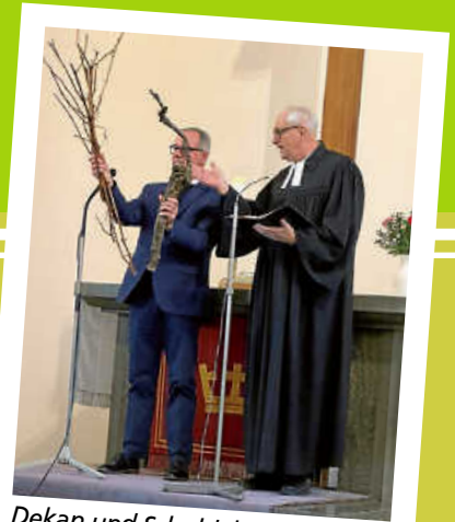
Dekan und Schuldekan bei der Dialogpredigt