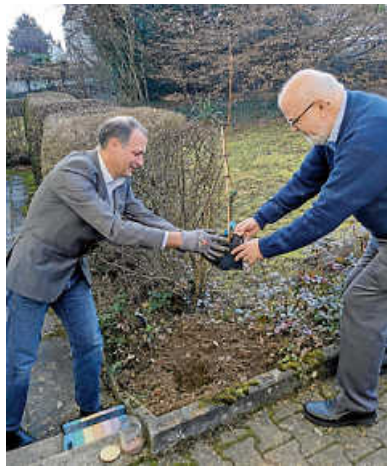
Übergabe des Weinstocks