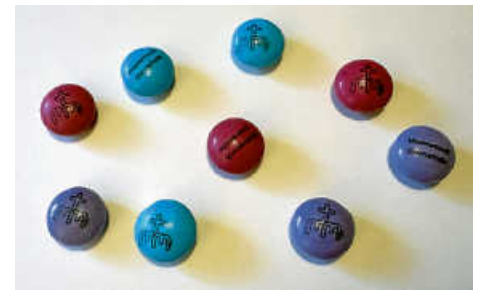
m&m's mit dem neuen Gemeindelogo