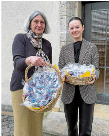
Präsentation der m&m's