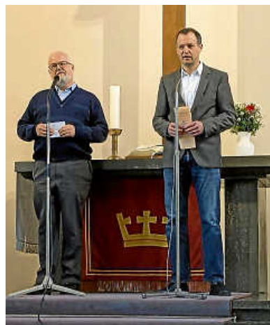
Ansprache der Vorsitzenden