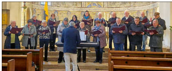
Matinee in St. Ottilia

Chor der Chorgemeinschaft Münster wunderschöne besinnliche Lieder mit Klavierbegleitung. Die Vorstellung wurde mit viel Beifall bedacht.