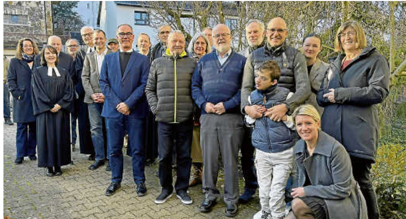
Kirchengemeinderat und Dekane