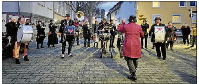
Die Guggenband stimmt das Publikum ein

5. Jahreszeit zu eröffnen. Bei warmen und kalten Getränken wurde am Dreieckle tapfer den äußeren Bedingungen getrotzt! Selbst der Regen konnte die heitere Stimmung nicht trüben. Für musikalische Unterhaltung sorgte die Guggenmusik Immortalis aus Bietigheim.