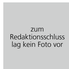
Vogl, Dominik Alternative für Deutschland (AfD) Monteur Gas/Wasser Listenplatz 43