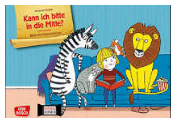
Grafik: © Don Bosco

So, jetzt kann es losgehen ... oder etwa nicht? Die Tiere wollen zusammen ein Buch lesen, doch irgendwer schlägt immer quer: Bevor der Lesespaß beginnen kann, braucht die Katze ihr Kuschkissen und der Fisch will auch etwas sehen. Als sich schließlich das tollpatschige Nashorn auf die Suche nach seinen Hausschuhen macht, ist das Chaos komplett. Für Kinder von 2 bis 6 Jahren Di., 21.05. / 15.30 Uhr