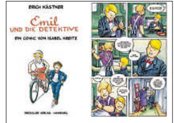
Grafik: © Dressler Verlag

Erich Kästner war als Schriftsteller und Kinderbuchautor sehr beliebt. 2024 wird sein 125. Geburtstag und sein 50. Todestag gefeiert. Mit dem Kinderbuch „Emil und die Detektive“ wurde er weltberühmt. Eine 5. Klasse der Elise von König Schule las den Comic von Isabel Kreitz nach der Vorlage von Kästner bei einem Workshop in der Bibliothek in verteilten Rollen vor. Die Klasse kommt seit ein paar Wochen regelmäßig in die Bibliothek für eine besondere Lesezeit. Die Kids fanden schnell in ihre Rollen und hatten ein gutes Lesetiming. Einige übernahmen gleich mehrere Sprechfunktionen und veränderten für die andere Rolle ihre Stimme. Das gemeinsame Leseerlebnis hat allen sehr gut gefallen.