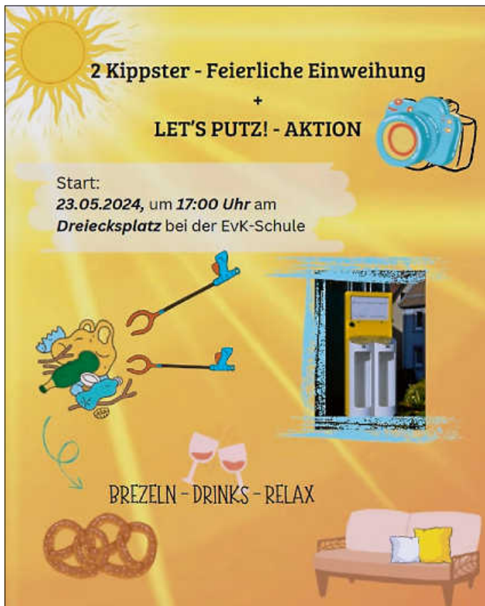
Plakat: Eleni Stoimenidou

Wir hoffen auf viele Interessierte und Mitstreiter bezüglich der Let's Putz-Aktion. Kommt/ Kommen Sie einfach vorbei!