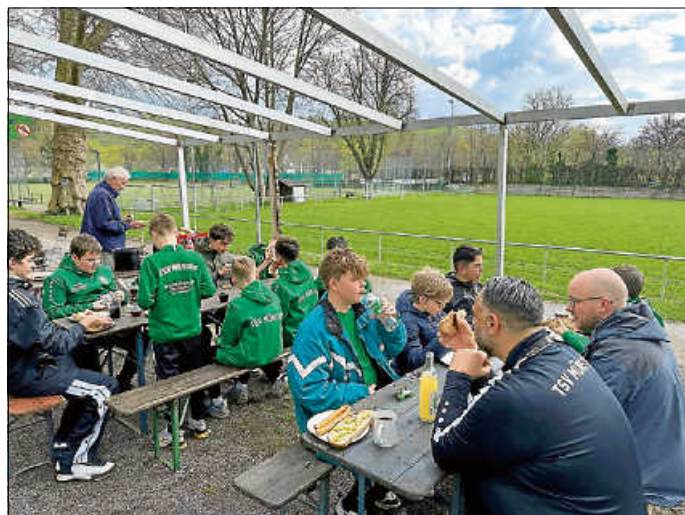
Die Stärkung war sehr willkommen