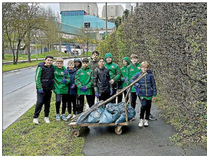
Es kam einiges zusammen