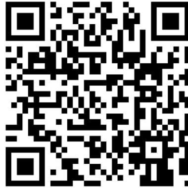
QR-Code Meine Umwelt-App

Weitere Informationen zur Asiatischen Hornisse und wie sich die Art von heimischen Insekten unterscheiden lässt finden sich auf der Homepage der LUBW https://www.lubw.baden-wuerttemberg.de/natur-und-landschaft/asiatische-hornisse sowie auf der Homepage der Landesanstalt für Bienenkunde der Universität Hohenheim unter https://bienenkunde.uni-hohenheim.de/vespavelutina . Dort finden sich auch weitere Informationen, wie Bürgerinnen und Bürger aktiv bei der Suche nach Tieren und Nestern mitwirken können. Seit April 2024 koordiniert die Landesanstalt für Bienenkunde in Stuttgart-Hohenheim im Auftrag der Naturschutzverwaltung das landesweite Management der Asiatischen Hornisse (Kontakt siehe Homepage).