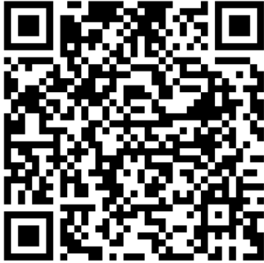
QR-Code Meldeplattform Asiatische Hornisse

Württemberg. Dies ist über die Meldeplattform auf der Homepage der Landesanstalt für Umwelt (LUBW), aber auch über die kostenlose „Meine Umwelt-App“ möglich: