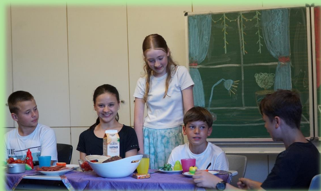
Schülerinnen und Schüler der 6a beim Sketch „Die Vorzeigekinder“

Dass die Schülerinnen und Schüler der Klasse 5 nach einem Jahr am ETG mittlerweile ein fester Bestandteil des Schullebens sind, belegten sie durch poetische Beiträge der 5c sowie einem Aktivparcours auf dem Pausenhof durch die 5b. Dem von der Klasse 6a aufgeführten Sketch „Die Vorzeigekinder“ folgte mit dem Auftritt der Schüler-Rockband V-Gang das umjubelte musikalische Highlight des Abends.